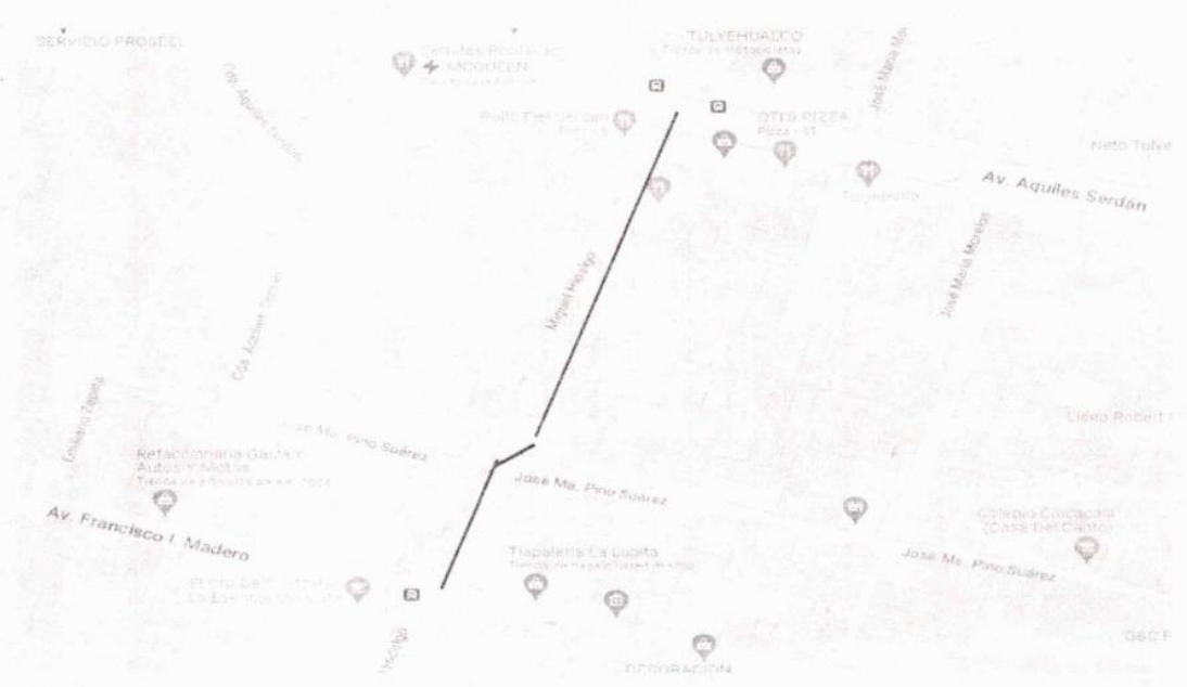
Miguel Hidalgo, entre Francisco I. Madero y Aquiles Serdán, colonia La Lupita.